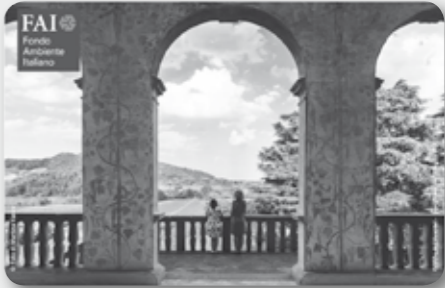
TESSERA FAI 2016

Sconti fin oltre il 50% in più di 1000 enti tra musei, mostre, dimore storiche, teatri e giardini in tutta Italia